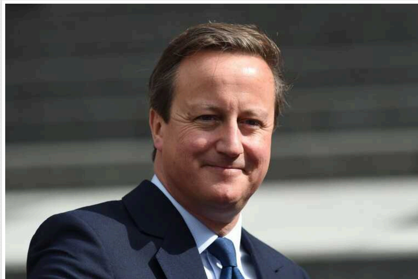
Велика Британія та її союзники розглянуть можливість визнання палестинської держави

Про це заявив голова МЗС Британії Девід Камерон, передає Financial Times.