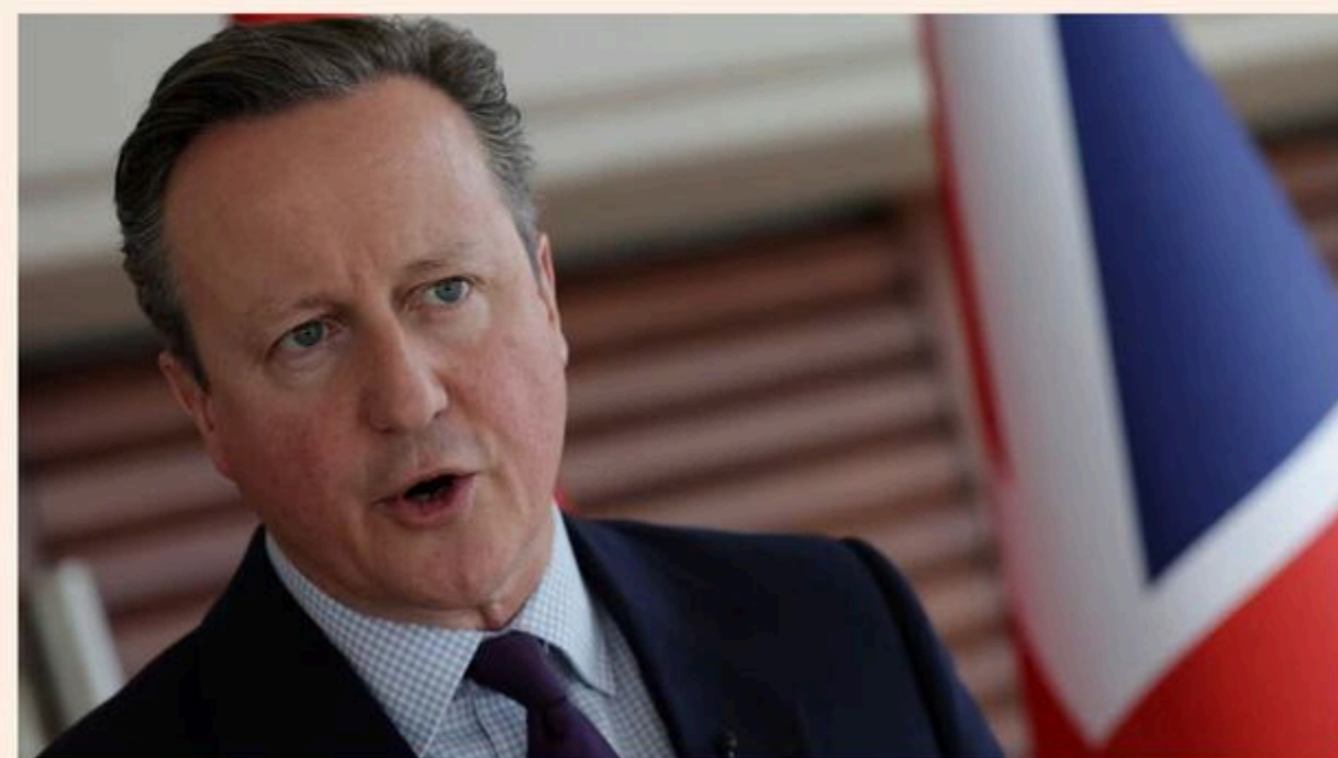
British foreign secretary Lord David Cameron. "Most important of all is to give the Palestinian people a political horizon"

UK foreign secretary says diplomatic moves could include UK and allies considering recognising Palestinian state