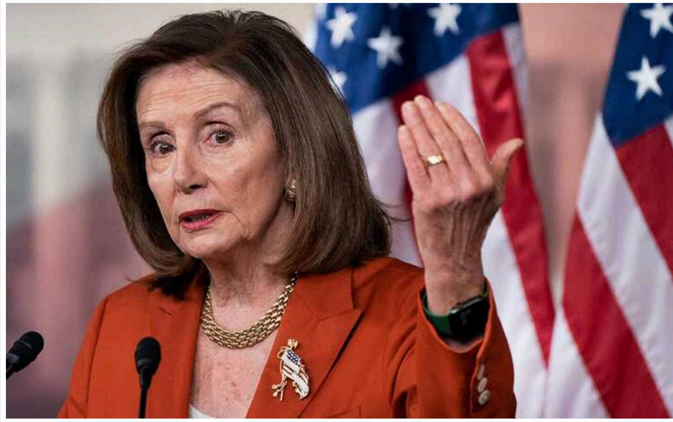
Протестувальники, які вимагають припинення вогню в Секторі Гази, можуть бути пов'язані з РФ, – Пелосі

Колишня спікерка Палати представників Конгресу США Ненсі Пелосі прокоментувала протести із вимогами до припинення вогню в Секторі Гази, де триває протистояння між Армією оборони Ізраїлю та терористами ХАМАСу. На думку політичній, деякі з учасників таких акцій можуть бути пов'язані з країною-агресором Росією.