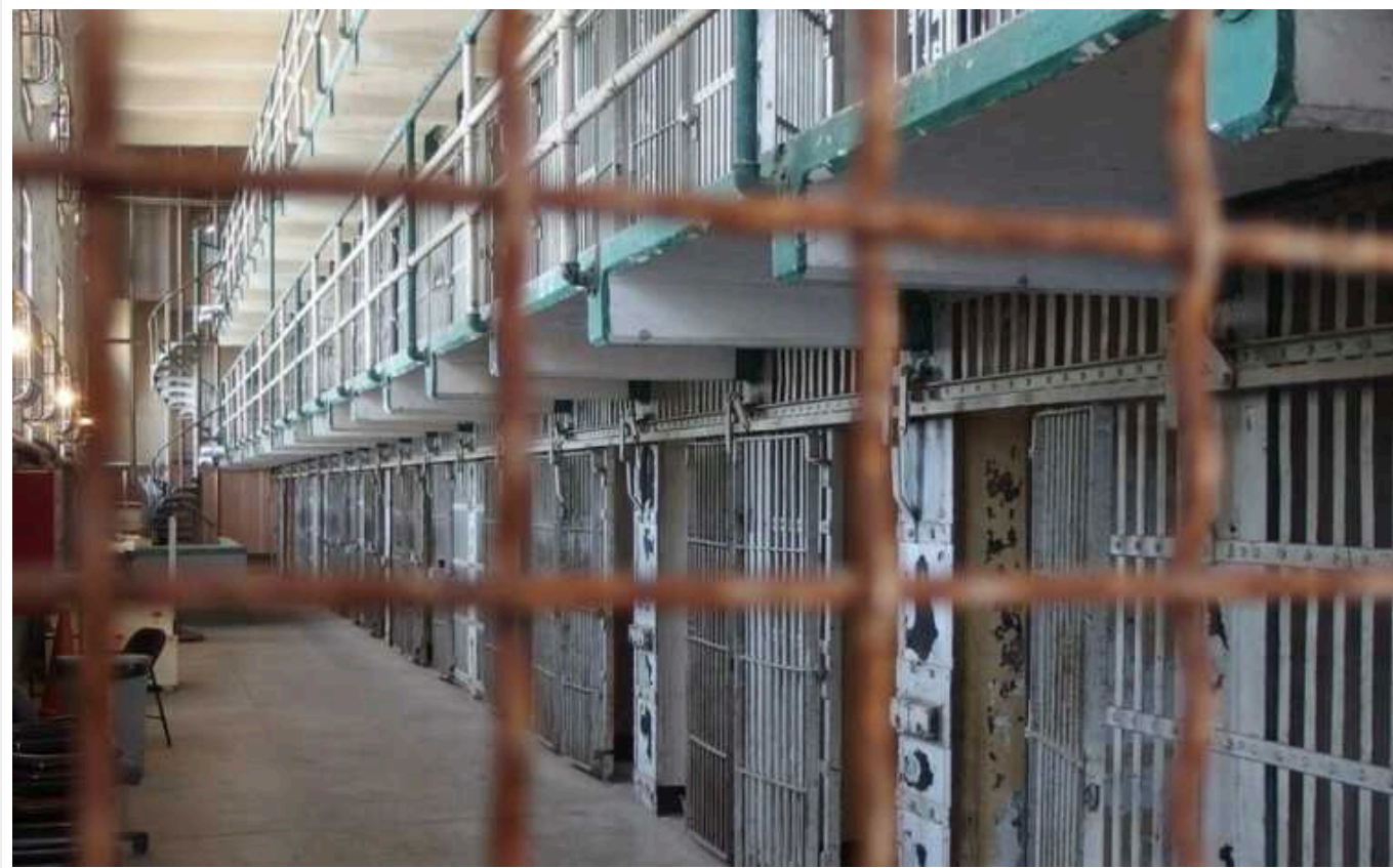
Закон про мобілізацію: судимі та ув'язнені

Народні депутати, урядовці та Генштаб продовжують обговорювати правки до скандального законопроекту про мобілізацію. Серед спірних норм є, зокрема, надання можливості ув'язненим та судимим добровільно вступати до лав армії. Ідею підтримують у Міністерстві юстиції, де вже напрацювали відповідні зміни до законодавства. А от Головнокомандувач Збройних сил України Валерій Залужний виступає категорично проти.