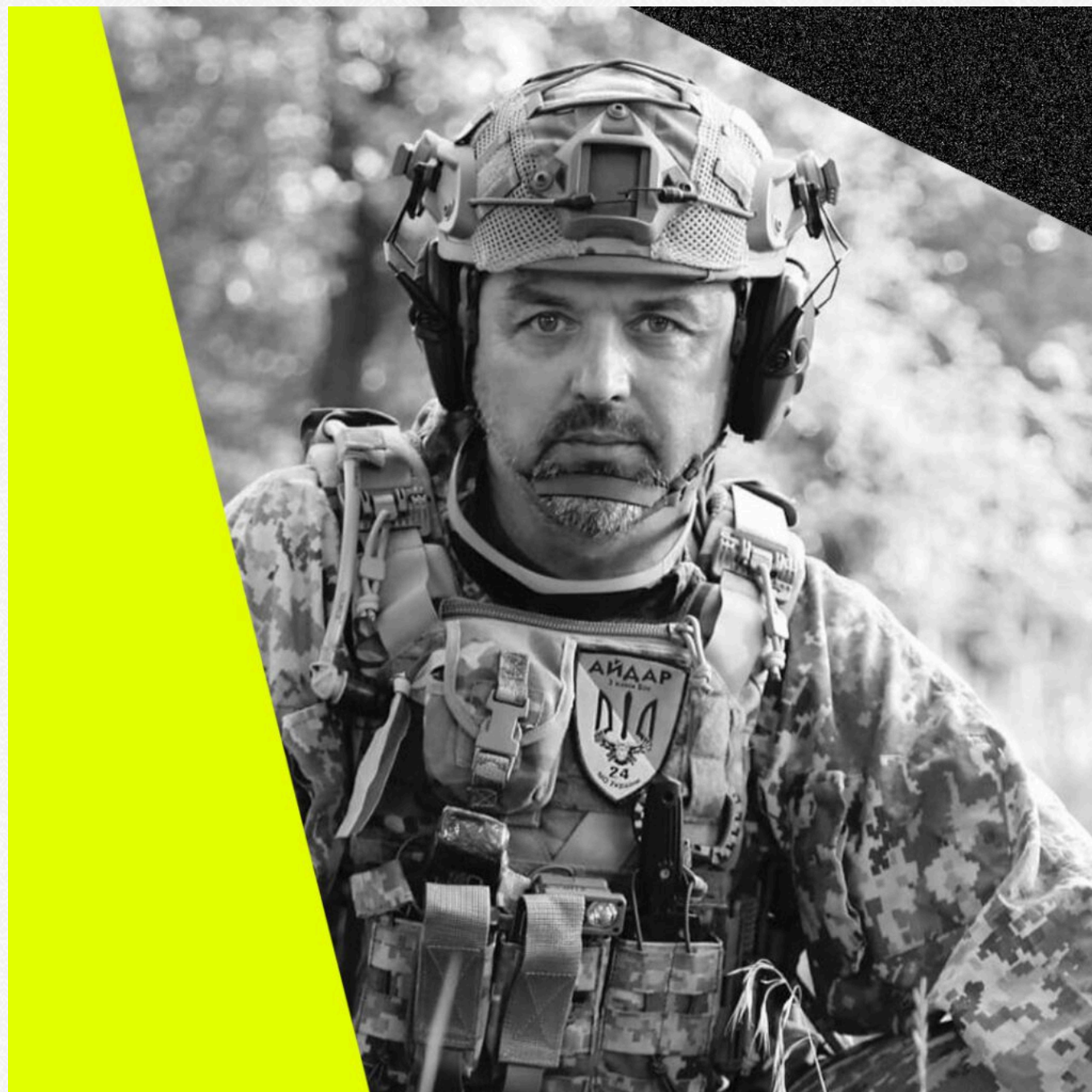
Ігор Лапін.

Юрист, депутат Верховної Ради України VIII скликання (2014–2019) та офіцер ЗСУ Ігор Лапін каже, що взагалі не розуміє, чому колишні засуджені позбавлені обов'язку захищати свою державу, якщо вони відбули покарання. Ба більше, багато з них стали на захист України з початку повномасштабної війни.