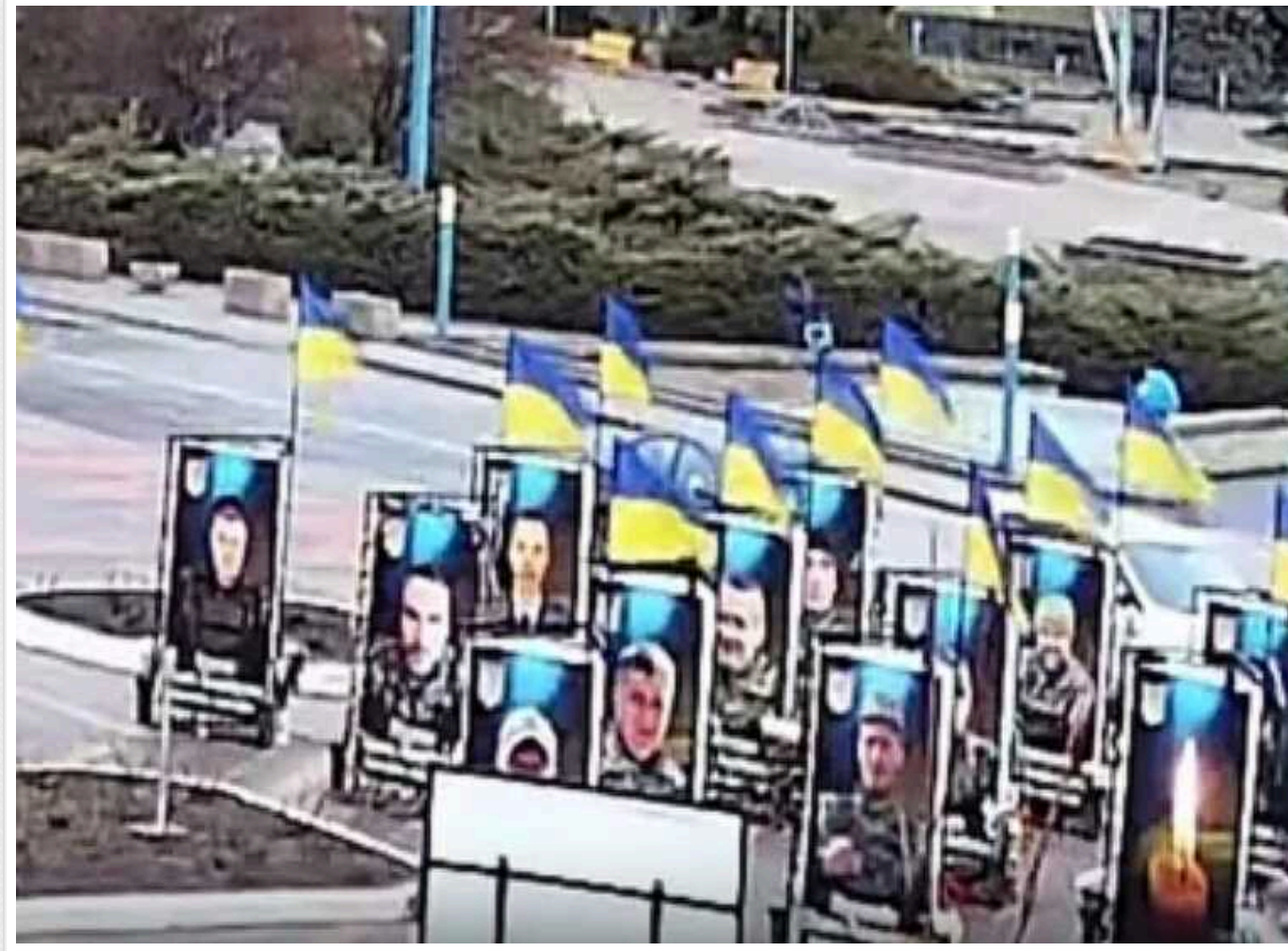
В Одеській області жінка систематично краде квіти з меморіалу загиблим захисникам України

У Южному на Одещині невідома жінка систематично краде квіти з Еспланади Пам'яті, де встановлено банери з портретами загиблих захисників України. Не соромлячись, вона приходить і збирає свіжі букети, ймовірно, для подальшого продажу.