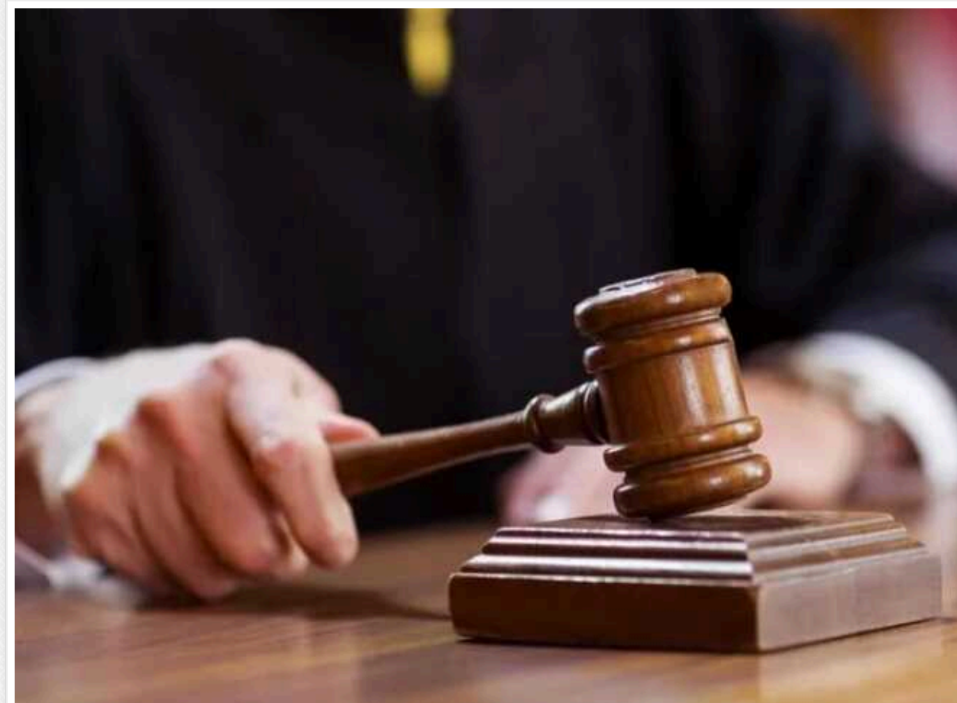
На Київщині судитимуть ексдиректора підприємства: "заробив" на ремонті школи та дитсадка

У Київській області судитимуть підрядника за заволодіння бюджетними грошима під час ремонту постраждалих внаслідок ворожих обстрілів садка та школи. Загалом він "заробив" майже 100 тисяч гривень.