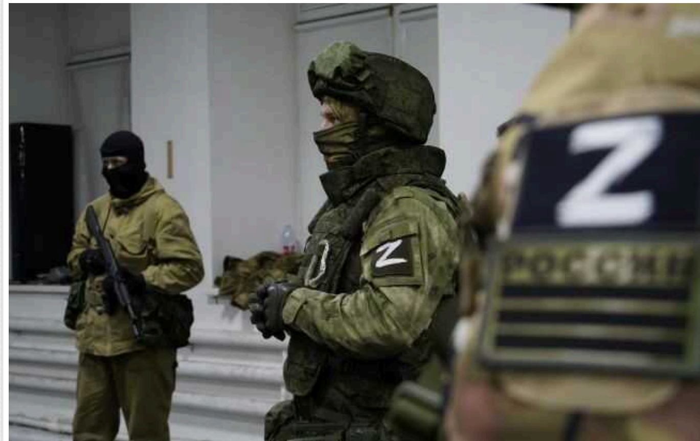
Стало відомо про розправу окупанта над мирним жителем на Херсонщині: розстріляв із автомата і закопав труп