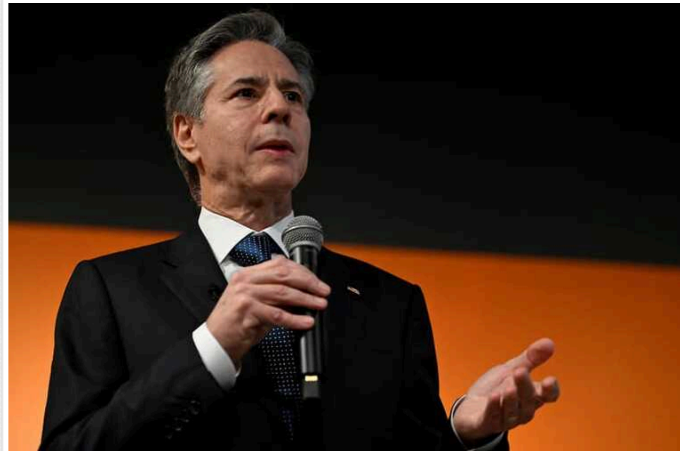
Держсекретар США Ентоні Блінкен: Україна обов'язково стане членом НАТО

Двері НАТО для України залишаються відчиненими, і вона обов'язково стане членом Північноатлантичного альянсу.