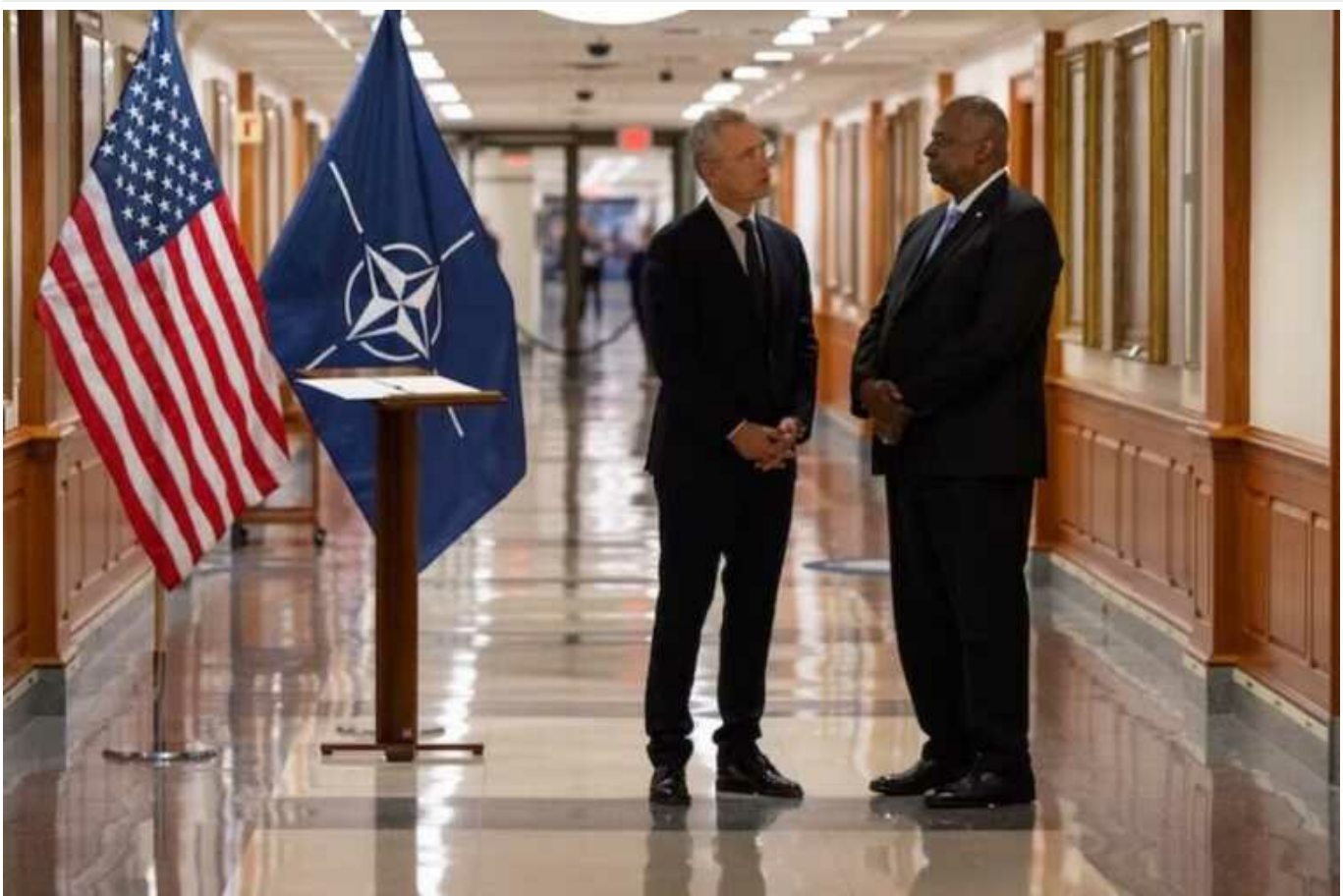
Остін та Столтенберг обговорили збільшення виробництва зброї для України

Глава Пентагону Ллойд Остін та Генсек НАТО Єнс Столтенберг обговорили допомогу Україні, зокрема критичність швидкого збільшення оборонного виробництва.