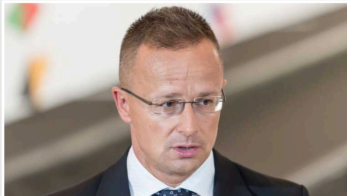
Чи постачатиме Угорщина зброю Україні: Петер Сіярто розставив всі крапки над "і"

Угорщина й надалі не буде поставляти Україні зброю, але допомагатиме гуманітарно, передає "УНІАН".