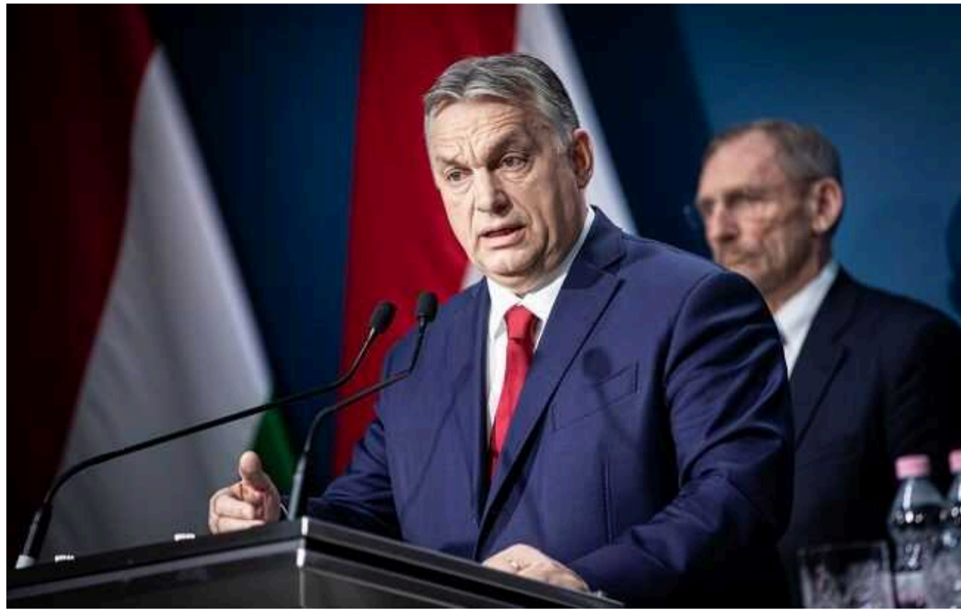
"Угорщина готова брати участь у рішенні ЄС, якщо буде гарантовано, що ми щороку вирішуватимемо, чи посилатимемо ці гроші, чи ні", - Le Point

Виктор Орбан наполягає, що проголосує за фінансування України, якщо Брюссель дозволить переглядати цю допомогу щороку.