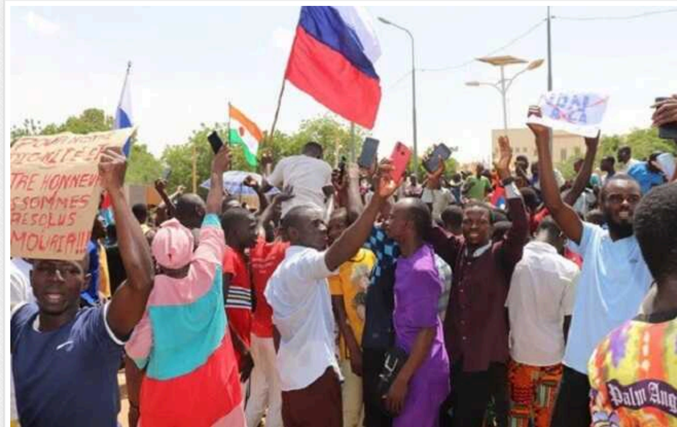
Кремль збирає 20-тисячне військо найманців: відкривають бази у п'ятох дружніх країнах Африки

РФ планує почати відкривати свої бази у п'ятох дружніх країнах Африки, щоб відновити вплив часів холодної війни.