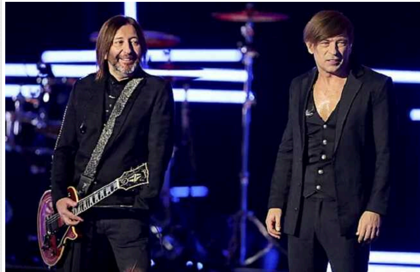
"Бі-2" спростували інформацію про вирішення питання з депортацією з Таїланду

Музиканти «Бі-2», яких затримали у Таїланді, спростовують інформацію ЗМІ, що питання їхньої депортації вже вирішено.