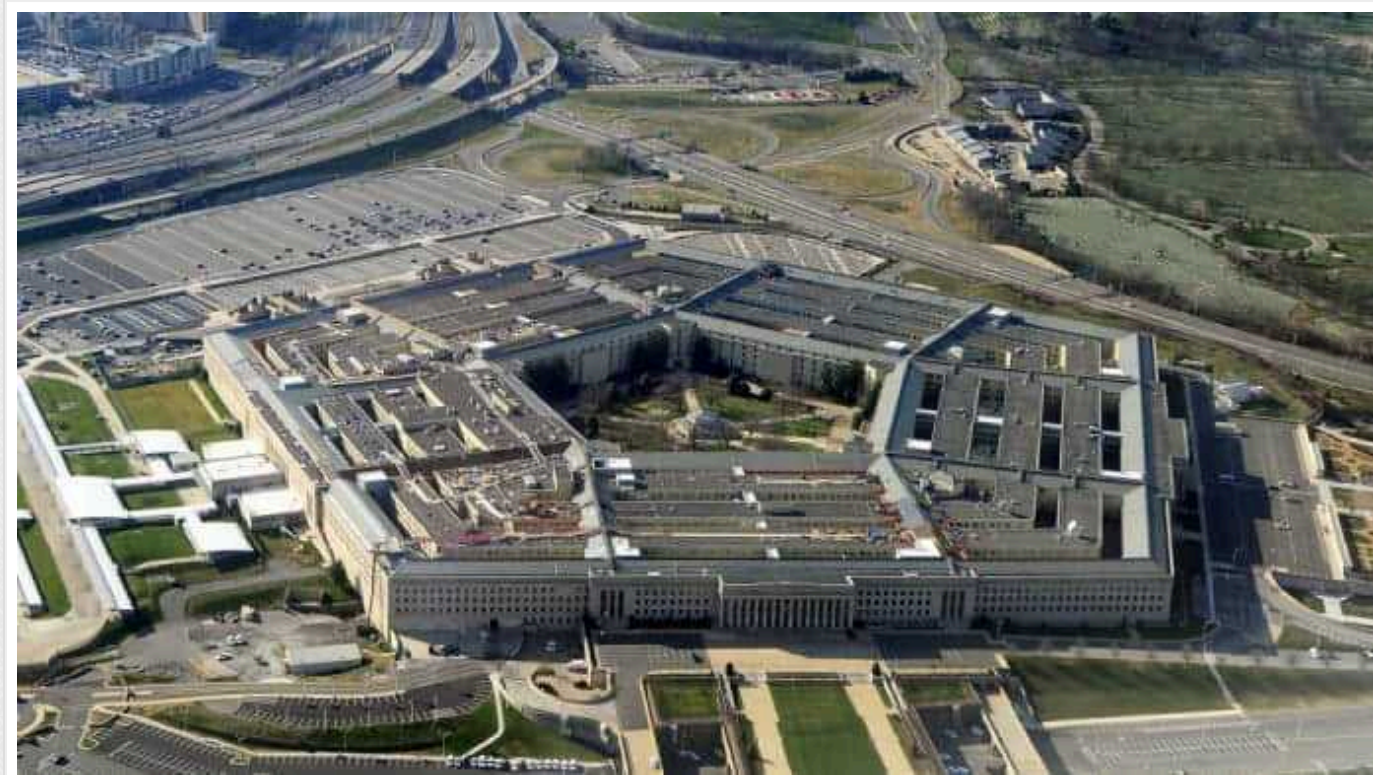
У Пентагоні обговорюють можливість ударів по іранському персоналу в Сирії чи Іраку, - Politico

Пентагон розглядає можливість ударів по іранському персоналу в Сирії чи Іраку або по іранським військово-морським об'єктам у Перській затоці у відповідь на вбивство трьох американських військових у Йорданії.