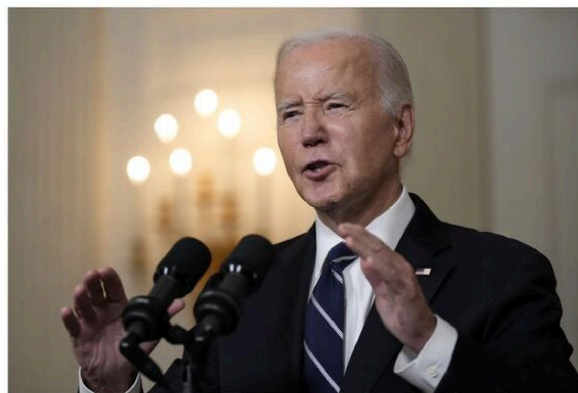
Joe Biden has carefully calibrated his response to the more than 160 attacks carried out by Iran-backed proxies hoping to take advantage of the chaos in the region in the wake of the Oct. 7 terrorist attacks.

The death of the service members in Jordan adds to rising Middle East tensions just as the 2024 voting begins.