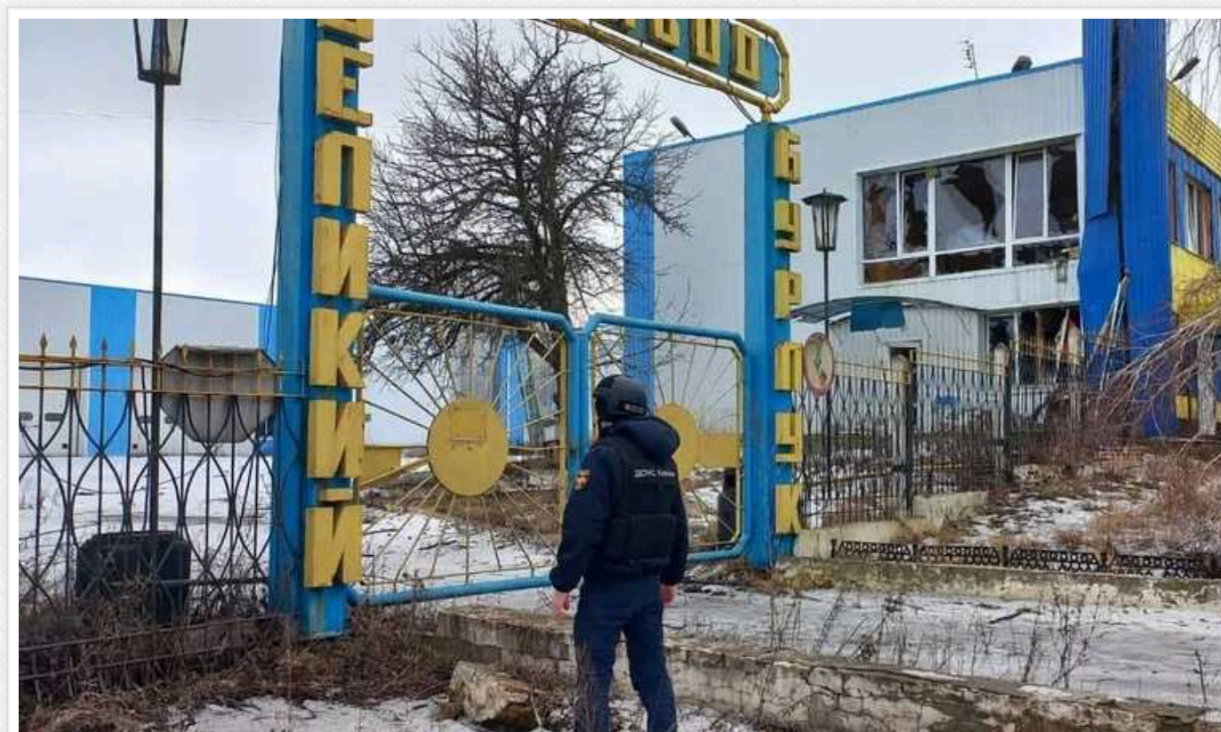
Окупанти скинули авіабомби на Великий Бурлук на Харківщині: пошкоджено підприємство

За даними від голови Харківської ОВА Олега Синегубова, об 11:40 окупанти вдарили керованими авіабомбами по смт. Великий Бурлук.