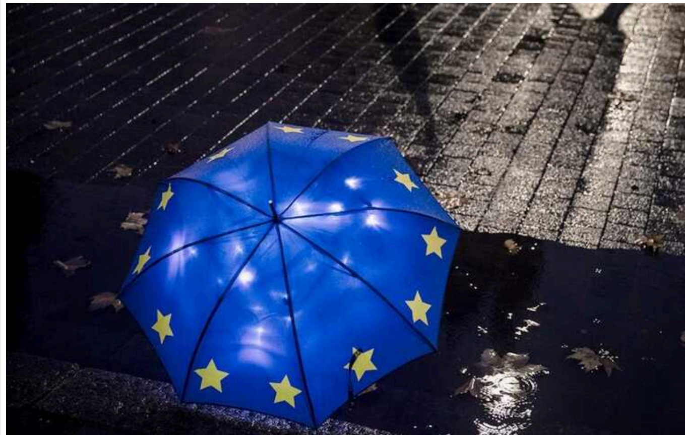
В Євросоюзі підтримали план вилучення прибутку із заморожених активів РФ, - FT