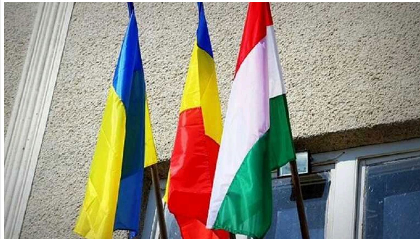
Росія намагається вбити клин між Україною та її західними сусідами: в ISW розповіли про задум Кремля

Країна-агресор Росія розпалює, а потім використовує у своїх цілях неоімперіалістичні та націоналістичні настрої у Європі. Мета Кремля – вбити клин між Україною та її західними сусідами.