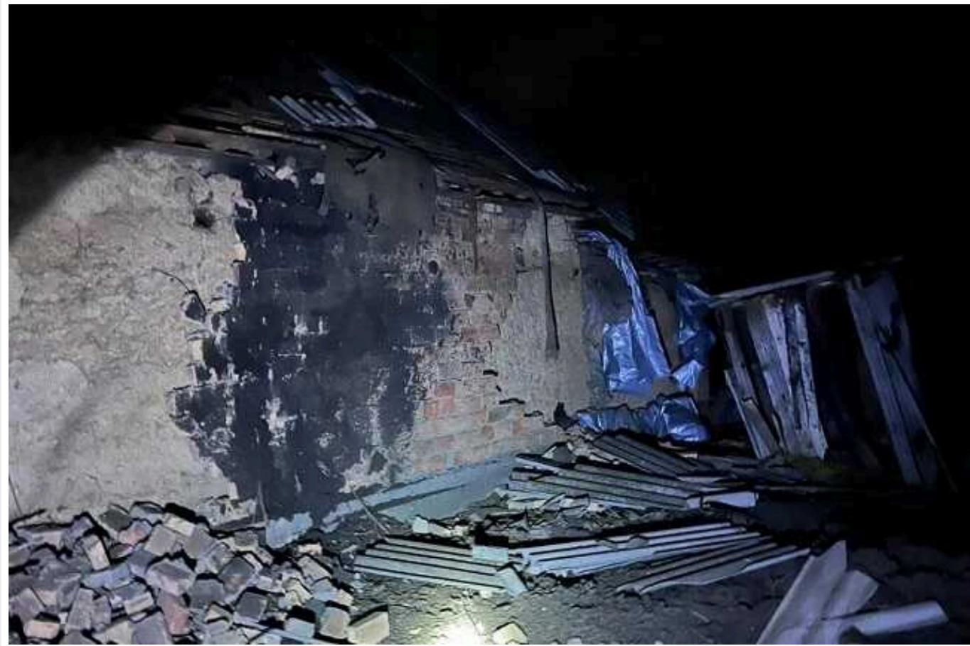
Окупанти атакували дронами Дніпропетровщину: є "приліт", спалахнула пожежа

Російській окупаційній військи під час повітряної атаки по Україні в ніч на 30 січня спрямували "Шахеда" на Дніпропетровську область. Захисники неба збили один дрон, водночас ще один призвів до "прильоту" у Криворізькому районі.