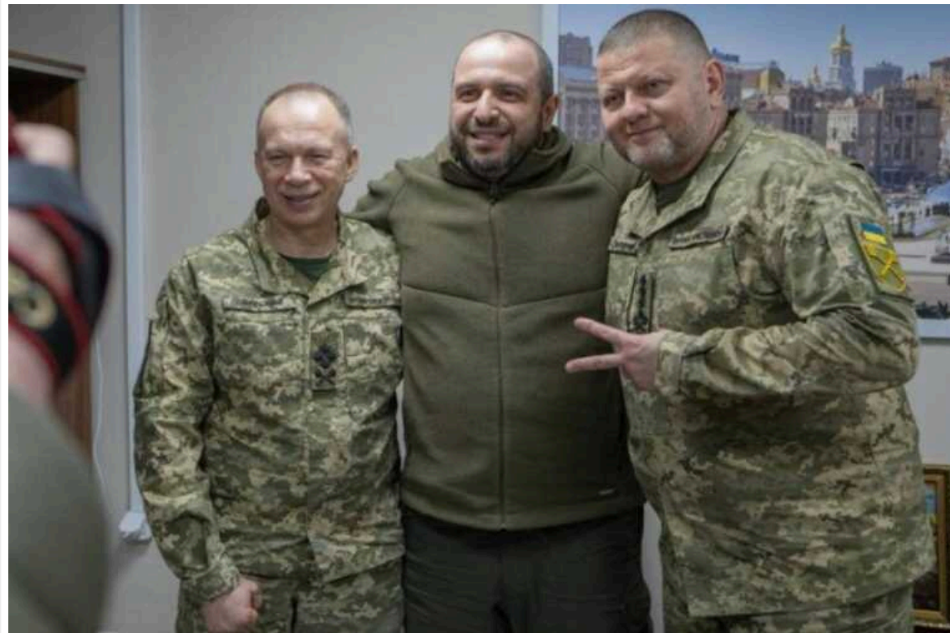
В мережі поширили фейкове звернення Зеленського: замість Залужного – Сирський

Російські ІПСО почали поширювати повідомлення про кадрові призначення в Генштабі ЗСУ у телеграм-каналах-двійниках.