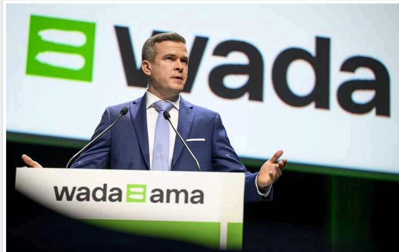
Після скандалу з російською фігуристкою Валієвою в WADA закликали ввести відповідальність за допінг у підлітків

Всесвітнє антидопінгове агентство (WADA) закликло світові уряди ухвалити закон про кримінальну відповідальність за вживання допінгу неповнолітніми особами.