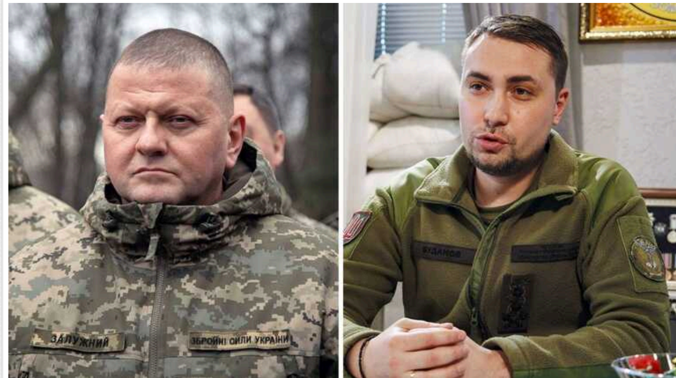
Журналіст Бутусов закликав президента Зеленського не призначати голову ГУР Буданова головноком ЗСУ

Незважаючи на спростування відставки головного комітету ЗСУ Залужного, його група медіа-підтримки продовжує закликати президента Зеленського цього не робити, а також не призначати новим головноком голову ГУР Кирила Буданова.