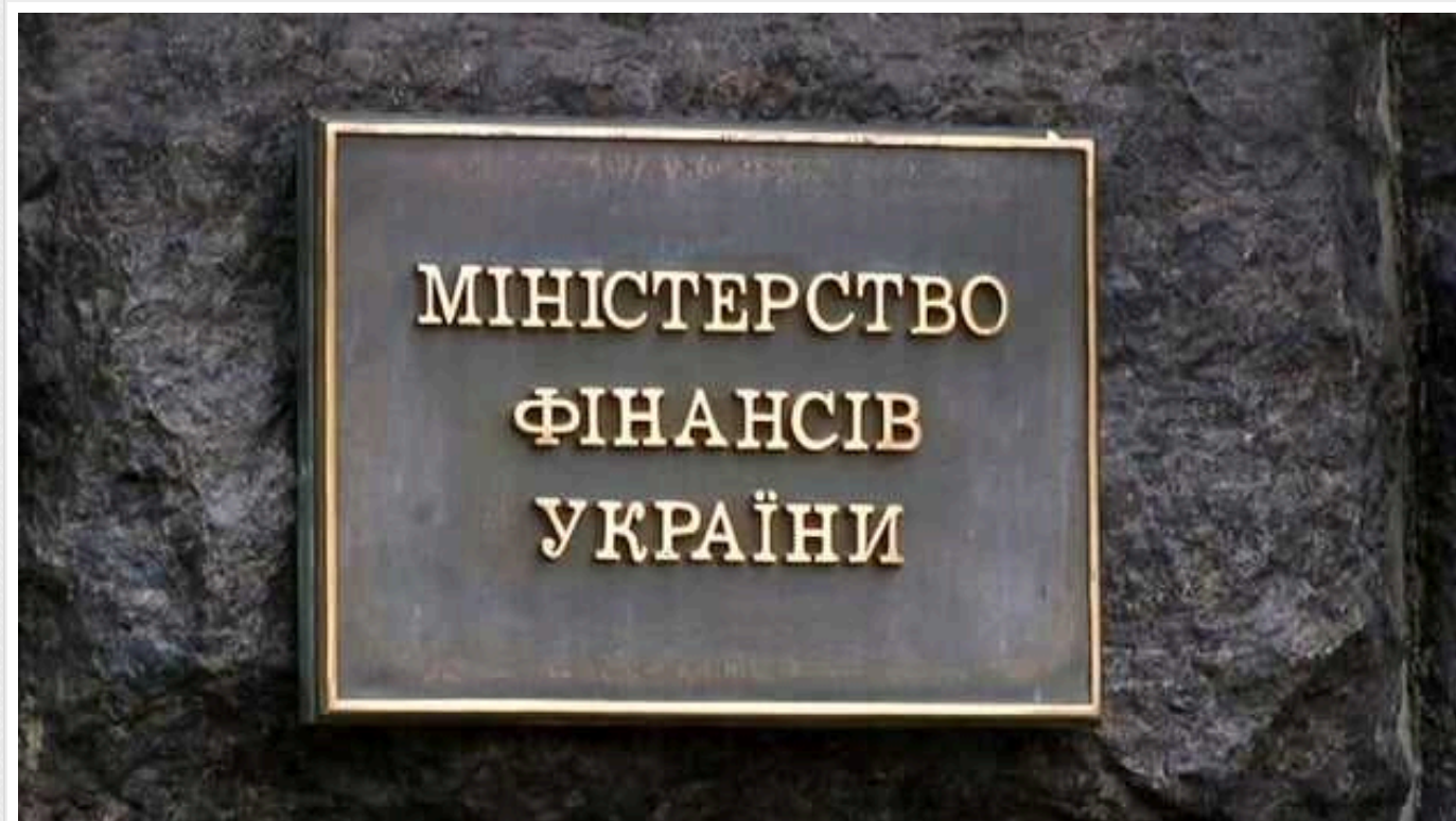
У Мінфіні назвали, скільки допомоги отримала Україна від початку повномасштабного вторгнення

Міжнародні партнери від початку повномасштабного вторгнення РФ спрямували до України 73,7 млрд доларів фінансової допомоги.