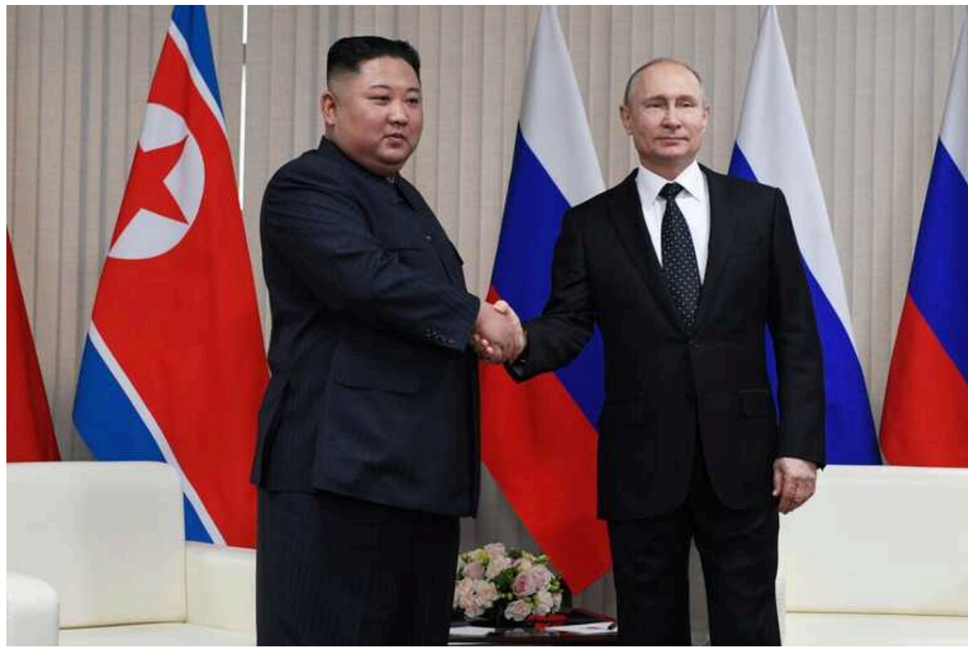
Візит Путіна до Північної Кореї: більше зброї проти України, секретний договір і підготовка до великої війни з Заходом

Президент РФ Володимир Путін планує найближчим часом відвідати Північну Корею, де зустріється із її лідером Кім Чен Инем. Здається, РФ щось дуже потрібно від КНДР, адже кремлівський диктатор боїться зайвий раз виїздити за межі своєї країни.