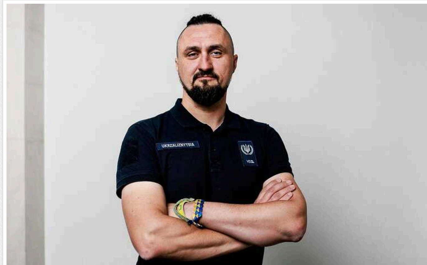
Міністр Олександр Камішін задекларував 17,5 мільйонів гривень доходу від продажу криптовалюти

За 2023 рік Олександр Камішін задекларував 3,18 млн грн заробітної плати на посаді керівника Укрзалізниці і 890 тис. грн - на посаді міністра.