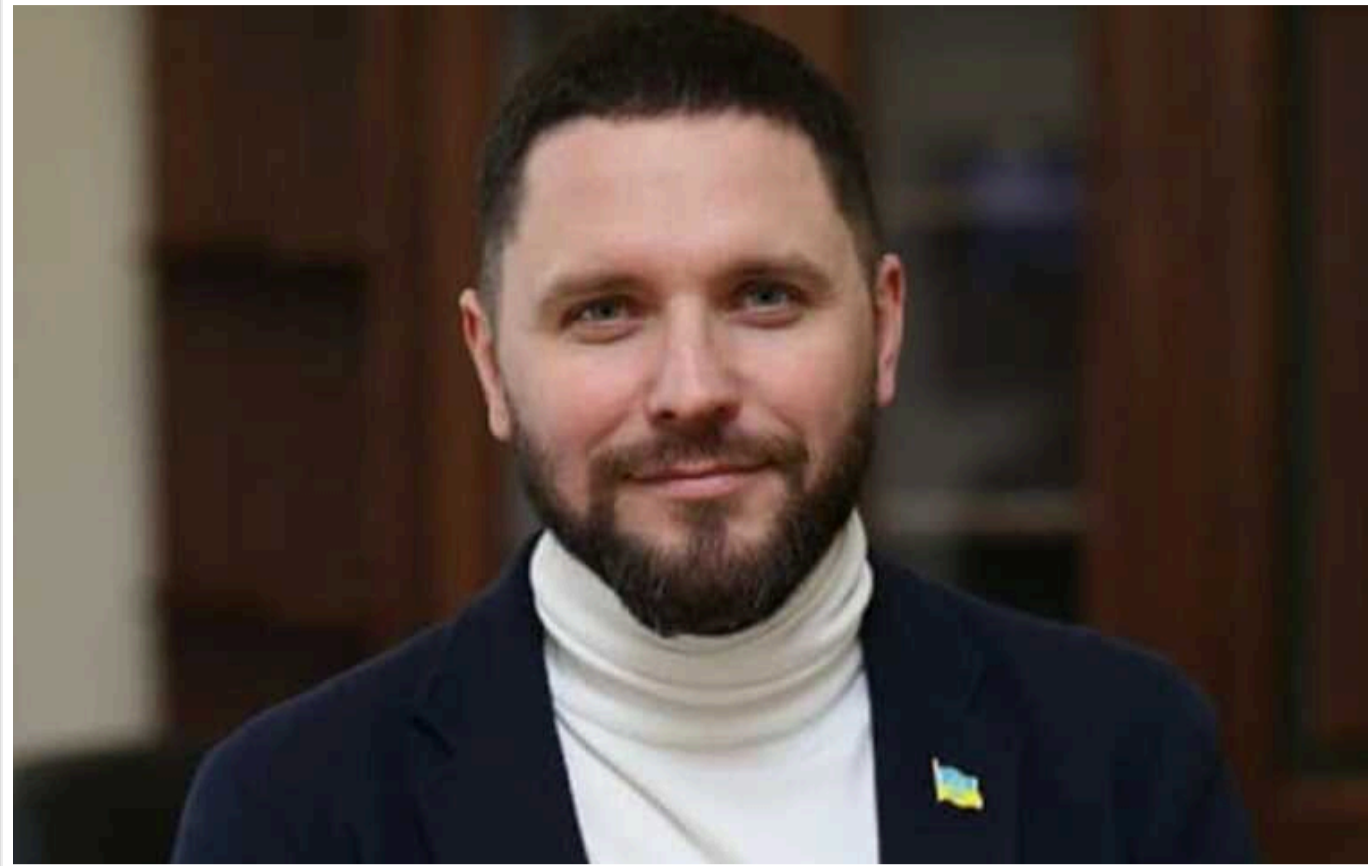
Рюкзак Louis Vuitton за 100 тисяч гривень і швейцарський годинник Montblanc: Що задекларував керівник Львівської митниці