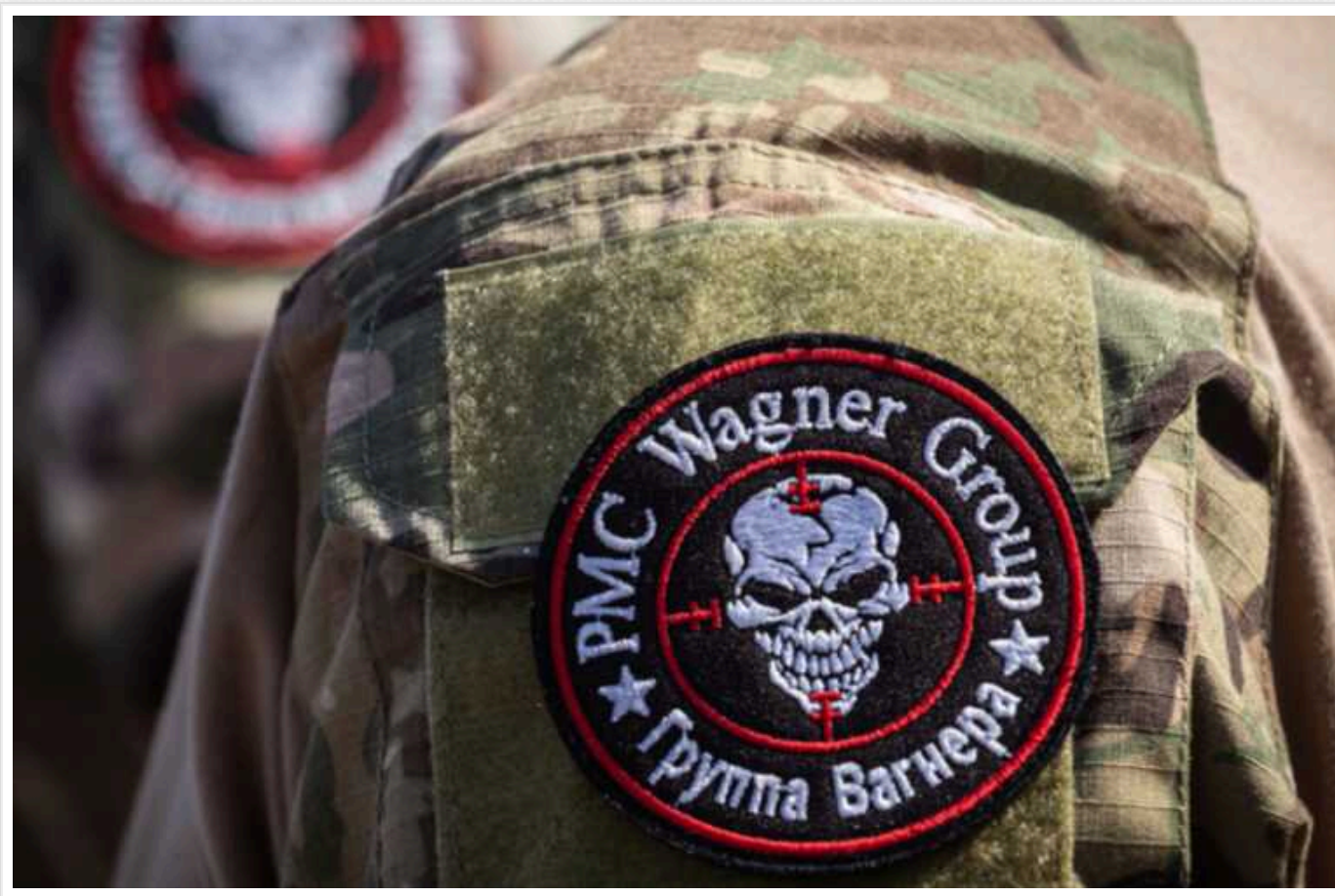
У РФ хочуть поставити пам'ятник ліквідованому в Україні найманцю ПВК "Вагнер": сидів за вбивство чоловіка на спір