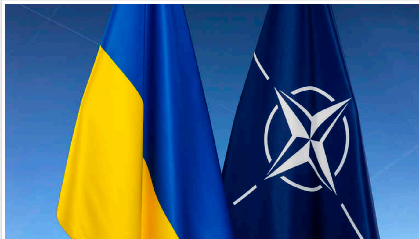
У Міноборони розповіли, скільки вже запровадили стандартів НАТО

Міністерство оборони, ЗСУ та інші складові сектору безпеки та оборони запровадили 315 стандартів НАТО. Це лише третина від загальної кількості.