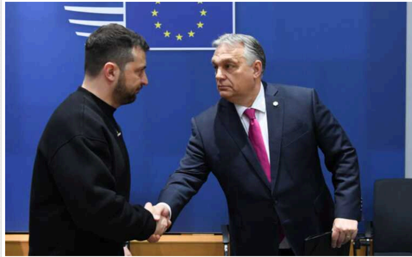
Зустріч Зеленського та Орбана має відбутися якнайшвидше, - Єрмак

Зустріч президента України Володимира Зеленського із прем'єр-міністром Угорщини Віктором Орбаном готується. Обидві сторони зацікавлені у якомога швидшому її проведенні.