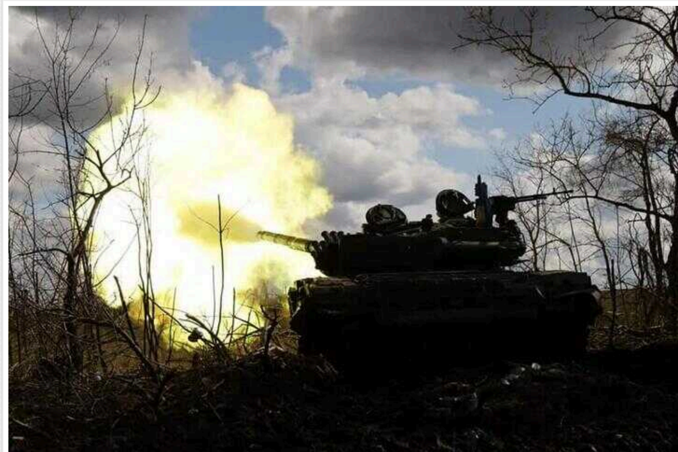
Ситуація на фронті: протягом доби відбулося 51 бойове зіткнення

Генштаб ЗСУ оприлюднив оперативну інформацію щодо російського вторгнення станом на 18.00 29 січня 2024 року.