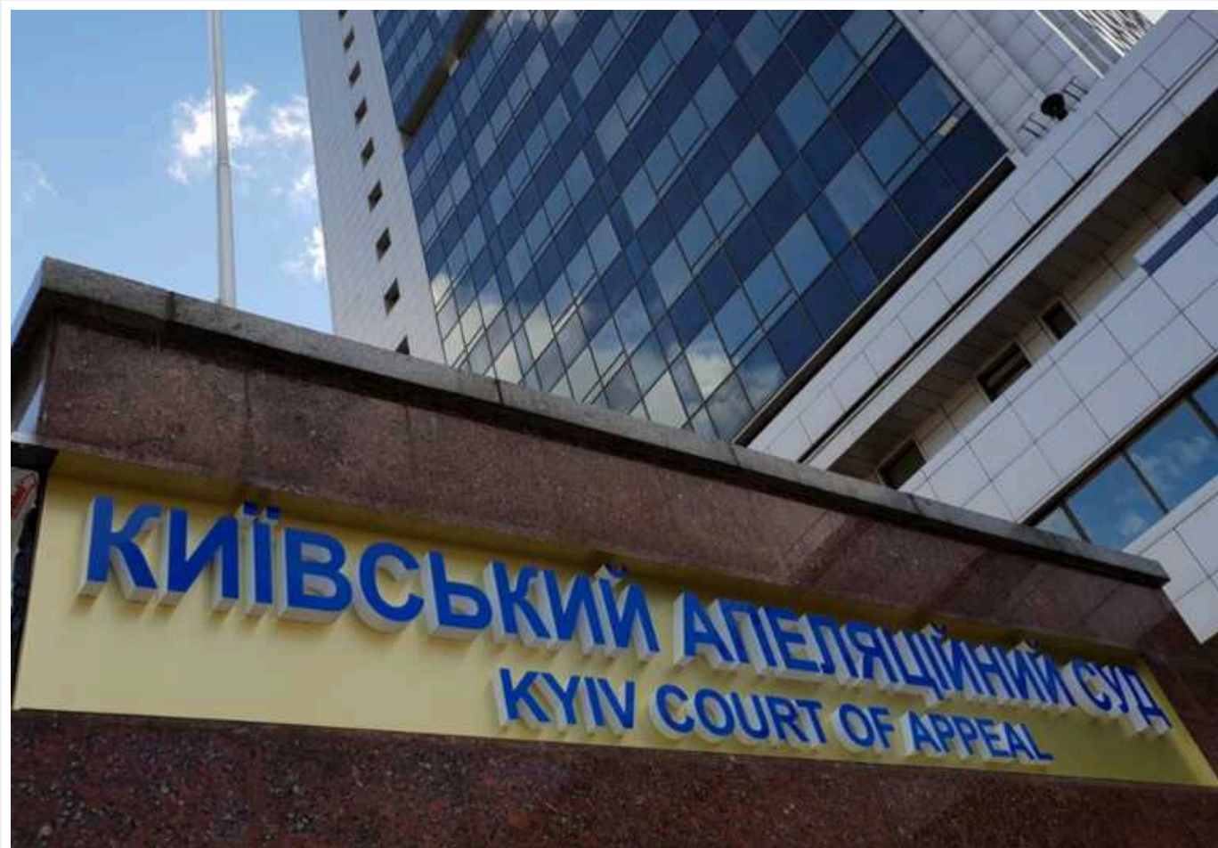
Апеляційний суд зменшив заставу брату Мазепи у 9 разів

Київський апеляційний суд у понеділок, 29 січня, частково задовольнив апеляційну скаргу адвокатів юридичної компанії "Міллер" і зменшив розмір застави Юрію Мазепі, брату засновника інвесткомпанії Concorde Capital Ігоря Мазепи, у дев'ять разів - із 44,9 млн грн до 5 млн грн.