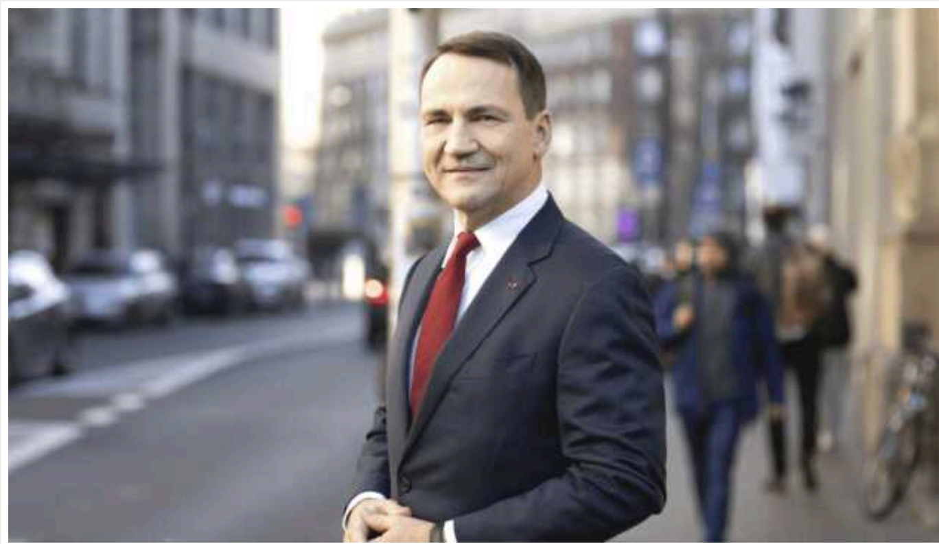
Польська опозиція закликає Сікорського у Берліні порушити тему репарацій

Ексзаступник глави МЗС Польщі, політик опозиційної партії "Право і справедливість" (PiS) Аркадіуш Мулярчик закликав чинного міністра закордонних справ РП Радослава Сікорського під час завтрашнього візиту до Берліна порушити питання виплати Німеччиною репарацій Польщі.