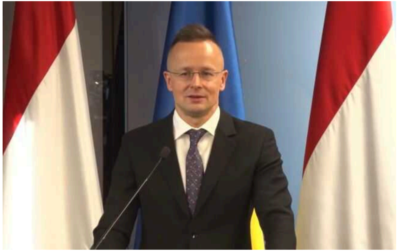
Сійярто уникнув відповіді, чи підтримує Угорщина вступ України в ЄС

Міністр закордонних справ Угорщини Петер Сійярто уникнув чіткої відповіді на запитання щодо позиції Будапешта про доєднання України до Європейського союзу.