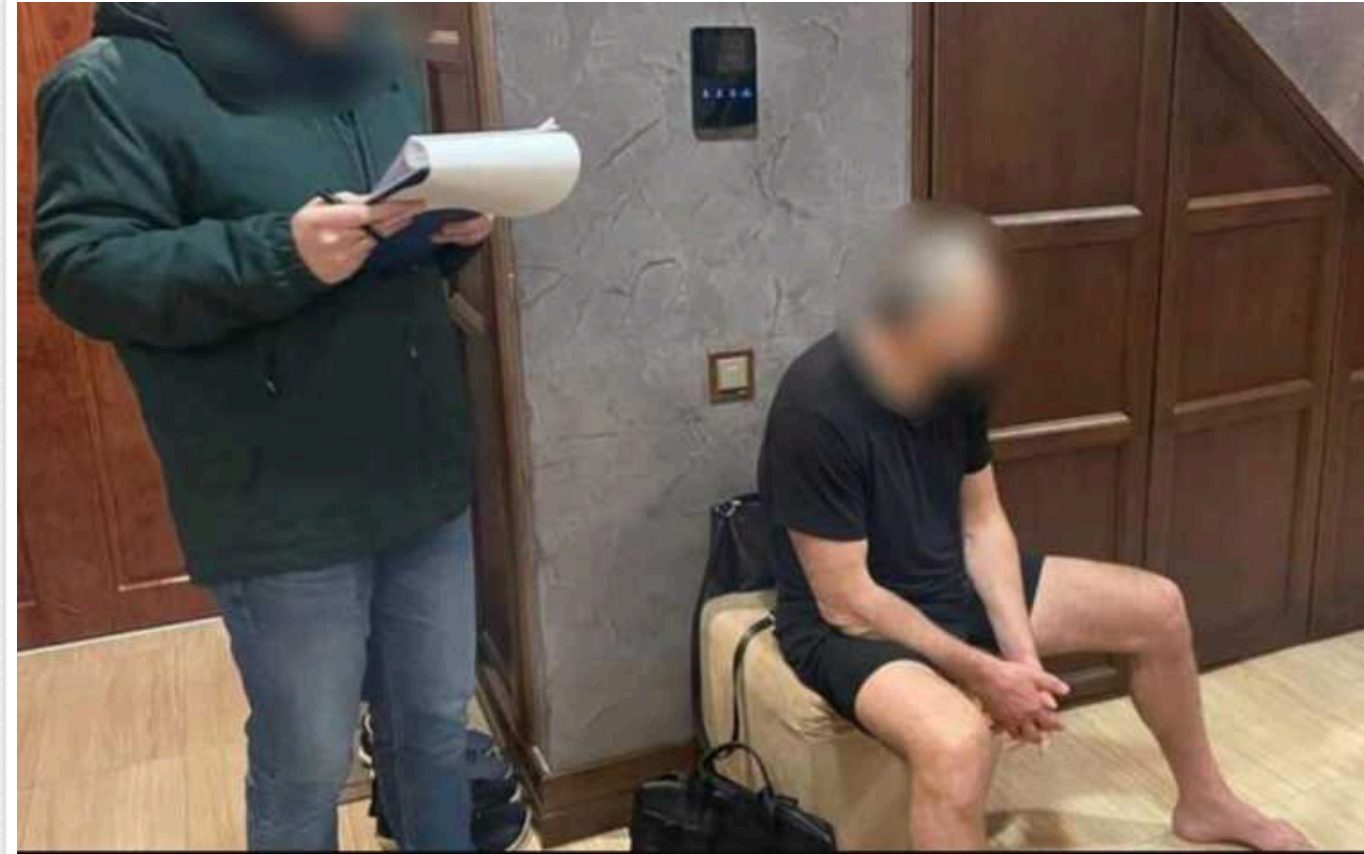
На Прикарпатті затримали кримінального авторитета, який вимагав борги у мешканців області

Працівники управління стратегічних розслідувань Нацполіції в Івано-Франківській області затримали 53-річного місцевого кримінального авторитета. Він організував злочинну групу, яка займалася вимаганням боргів у бізнесу та мешканців області. Затриманому загрожує до 12 років позбавлення волі.