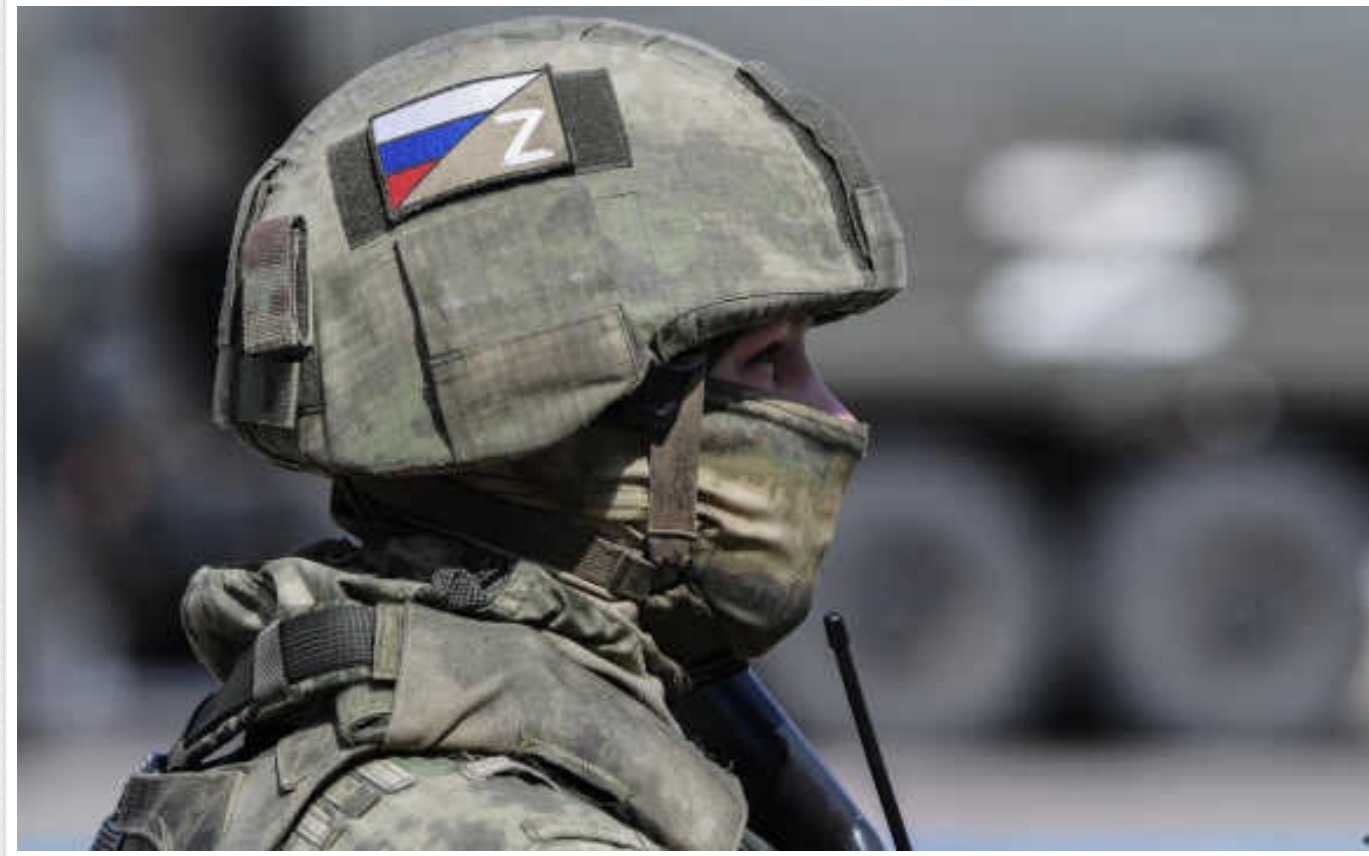
Російського окупанта, який розстріляв двох цивільних на Чернігівщині, засудили до довічного ув'язнення

"Установлено, що 1 квітня 2022 року військовослужбовці збройних сил РФ, перебуваючи в селі Гайворон Ніжинського району, незаконно позбавили волі трьох місцевих мешканців", - йдеться в повідомленні.