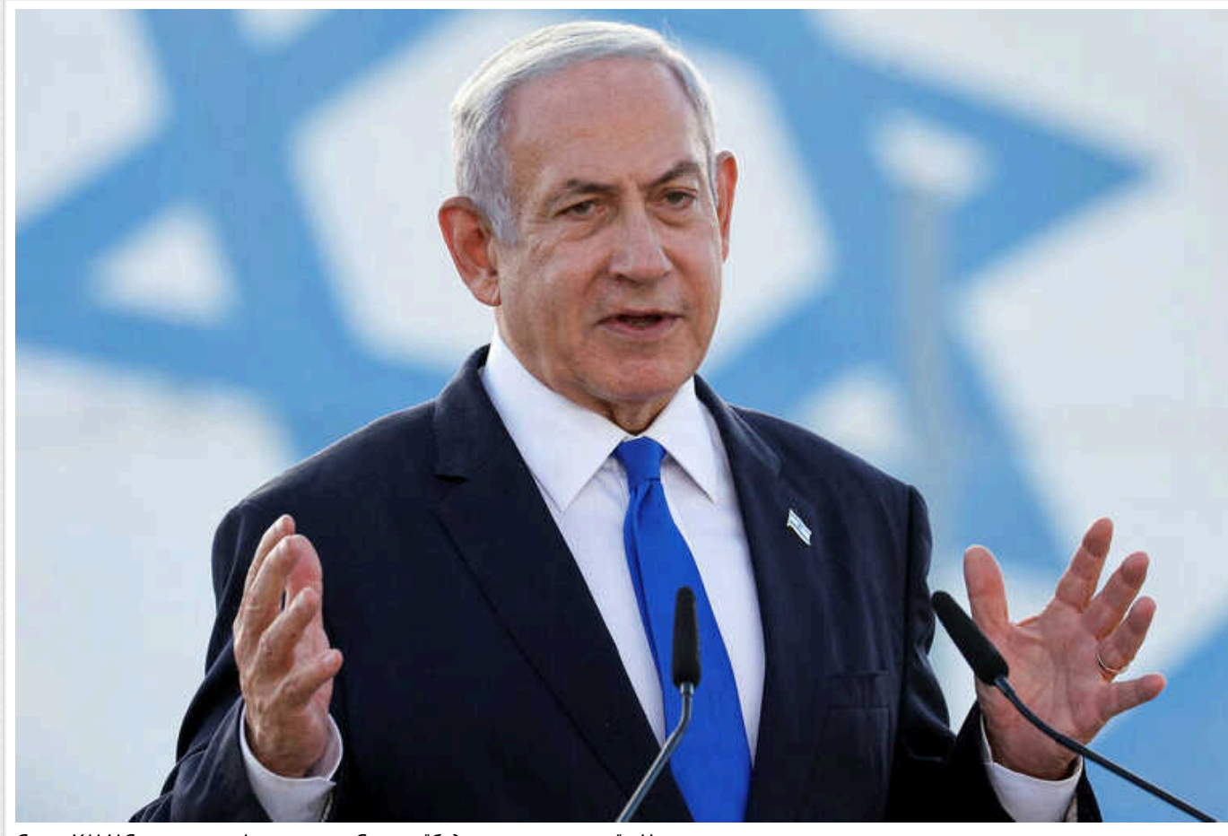
Якщо ХАМАС переможе, Америка та Європа "будуть наступними"; - Нетаньягу

"Якщо варварство переможе тут, то Європа та Америка будуть наступними. Ми повинні перемогти в Газі і здобути тотальну перемогу. ХАМАС не можна залишати", - сказав він в інтерв'ю Talk TV.