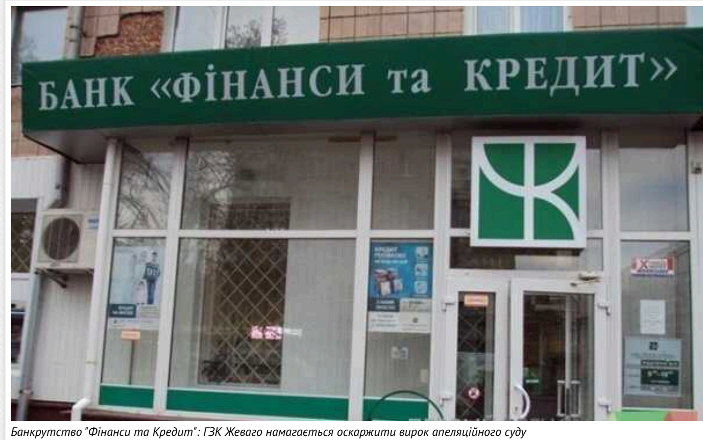
Банкрутство "Фінанси та Кредит": ГЗК Жеваго намагається оскаржити вирок апеляційного суду

Апеляційний суд підтвердив зобов'язання Полтавського гірничо-збагачувального комбінату щодо порук на 4,7 млрд грн за кредитами банку «Фінанси та Кредит». ПГЗК подасть апеляцію до Верховного Суду.