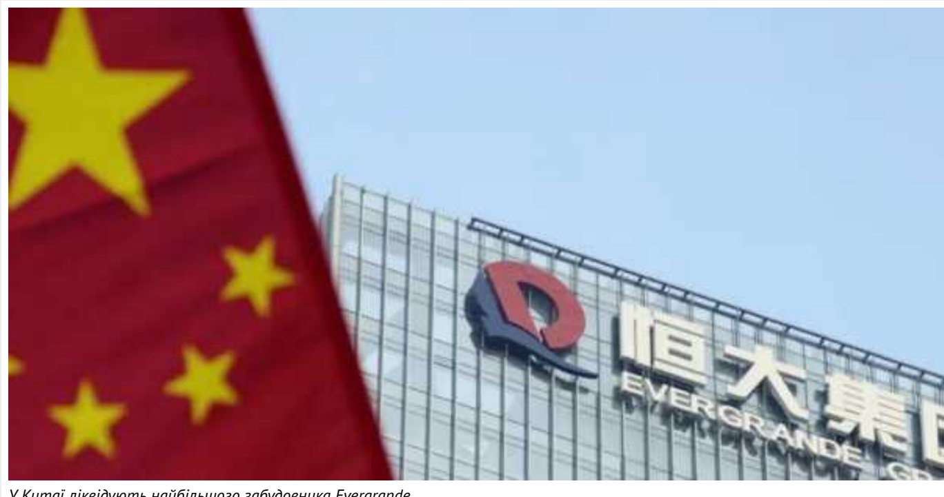
У Китаї ліквідують найбільшого забудовника Evergrande

Суд Гонконгу 29 січня ухвалив рішення про ліквідацію гіганта нерухомості China Evergrande Group. Це, ймовірно, спричинить хвилі на фінансових ринках Китаю, що руйнуються, оскільки політики намагаються стримати поглиблення кризи.