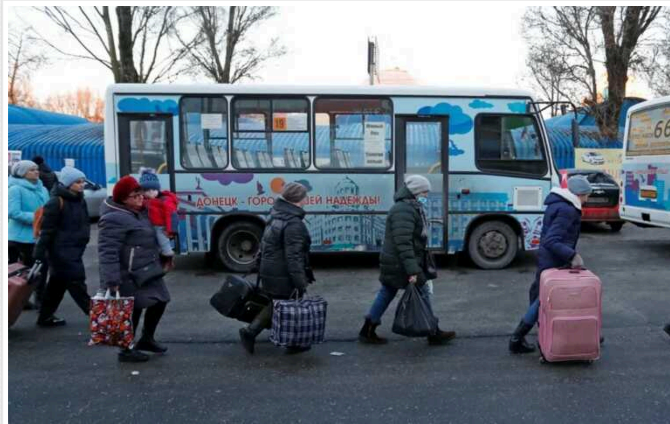
У Донецькій області оголосили примусову евакуацію ще з дев'яти сіл – ОВА

Координаційний штаб ухвалив рішення про примусову евакуацію з дев'яти сіл Мар'їнської та Очеретинської територіальних громад Донецької області.