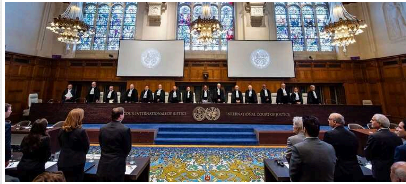
У Гаазі визначили дату, коли оголосять про прийнятність скарги України проти Росії щодо "геноциду"

Міжнародний суд ООН цієї п'ятниці оголосить рішення про прийнятність скарги України проти Росії щодо неправдивих звинувачень Києва у "геноциді на Донбасі", які Кремль використав для виправдання свого вторгнення.