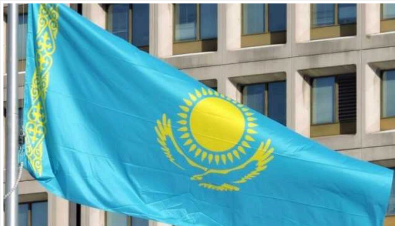
У Казахстані прийняли рішення вийти із угоди про секретні винаходи часів СРСР

Президент Казахстану Касим-Жомарт Токаєв ратифікував протокол про припинення секретності винаходів епохи СРСР.