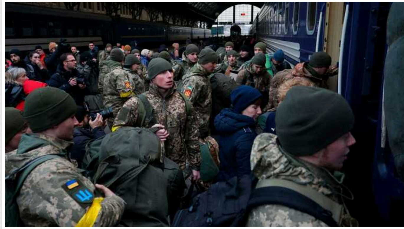
Нардеп розповів, як українці переховуються від ТЦК: немає інформації про 3,4 мільйона чоловіків

Голова комітету Верховної Ради України з питань економічного розвитку Дмитро Наталуха зауважив, що держава не знає, де ці люди. Вони всі призовного віку та "існують" на території України.