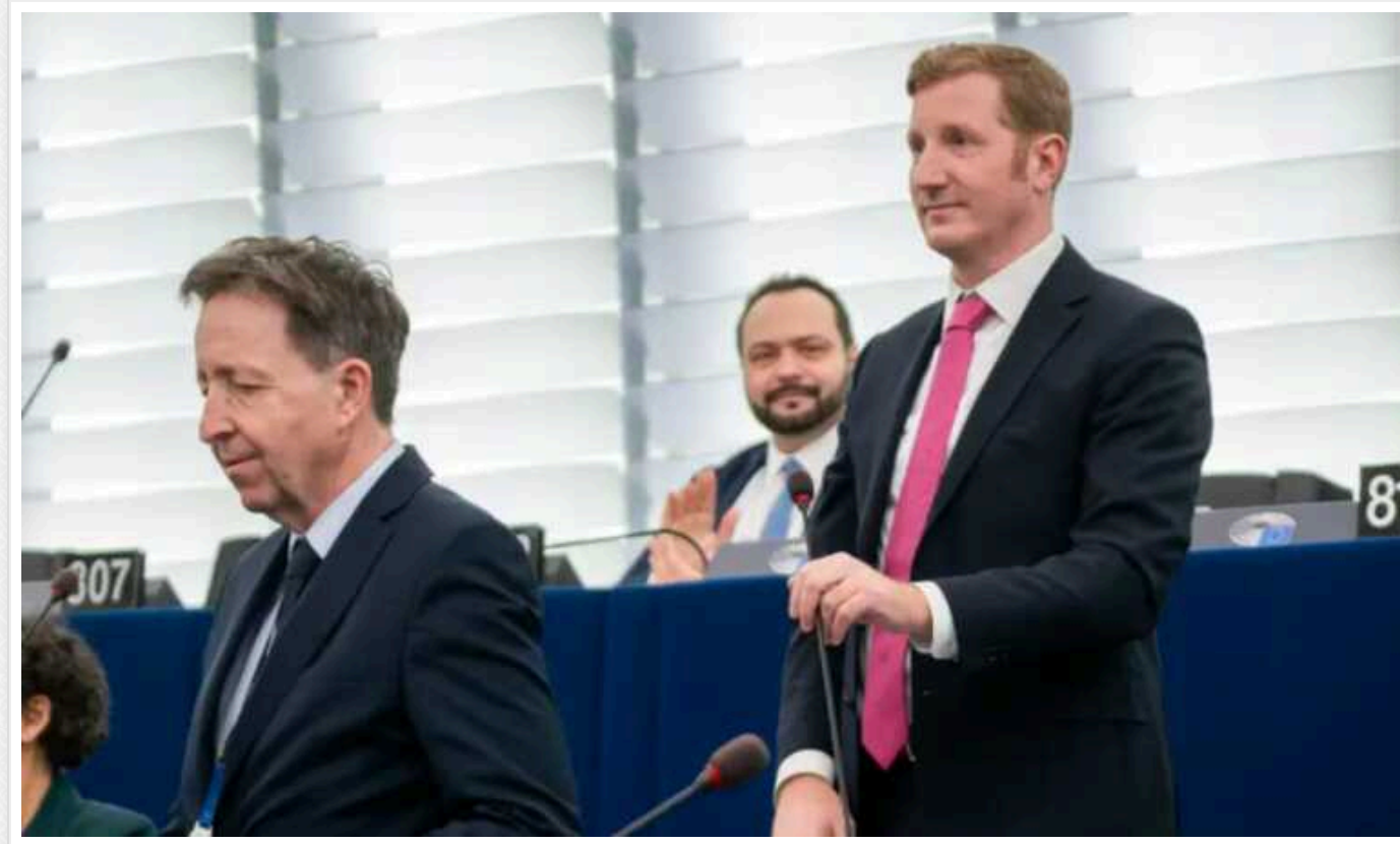
Швидкого прийняття України до Євросоюзу «не може бути», - віцеполова Європарламенту Ян-Крістоф Етьєн

Про це він заявив в інтерв'ю Nordwest-Zeitung.