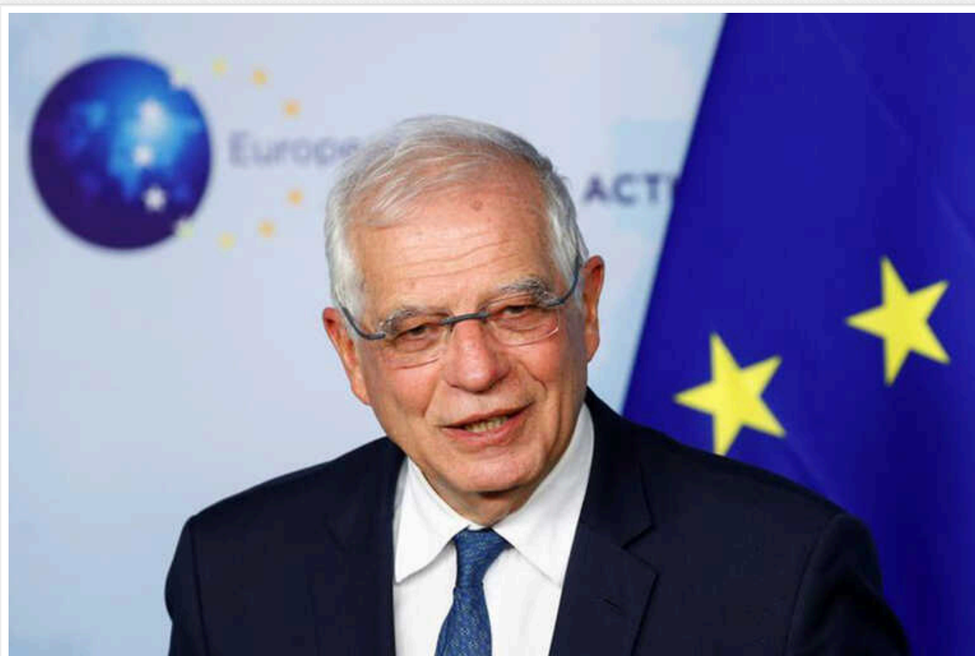
"Світла у кінці українського тунелю" не видно, - Боррель

"Війна триває, і бої лише посилюються, і ми не бачимо світла у кінці українського тунелю", - сказав Жозеп Боррель, виступаючи на форумі.