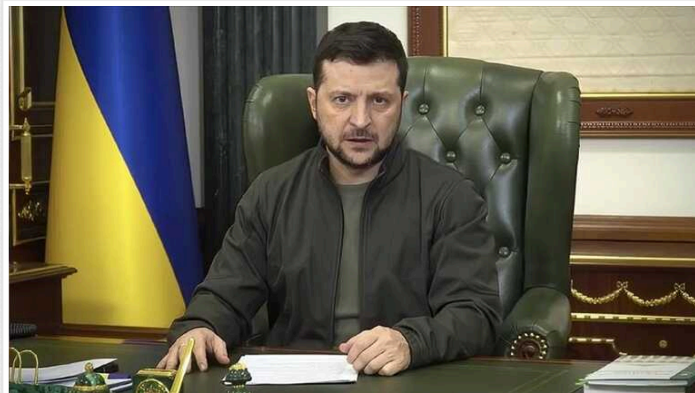
Зеленський знову закликав чоловіків мобілізаційного віку повертатися в Україну

Зеленський заявив, що вони потрібні не лише на фронті, а й для підтримки економіки.