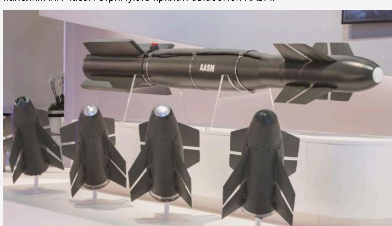
Блоки AASM Hammer в розібраному вигляді і разом з авіабомбою (зверху)

Пресслужба Міністерства оборони Франції також підтвердила, що українці найближчим часом отримують крилаті авіабомби AASM.