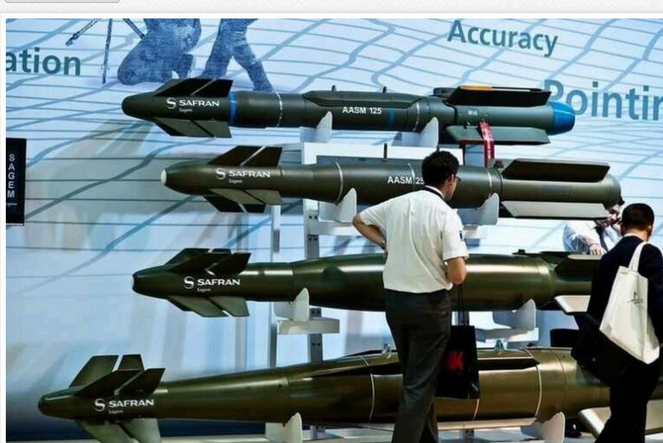
Україна отримає «розумні» французькі «молотки». Як це допоможе бити окупантів

Президент Франції Еммануель Макрон та міністр оборони Себастьян Лекорню анонсували передачу Україні "кількох сотень" бомб класу "повітря – земля". Мова йде про сучасні керовані авіабомби AASM Hammer, зазначає БІ-БІ-СІ.