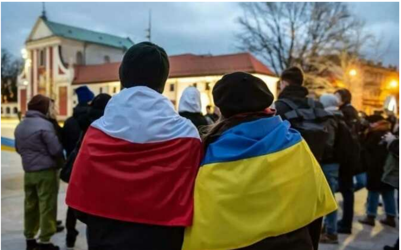
У Польщі перепишуть правила для українських біженців

Польща змінить правила перебування біженців з України вже 2024 року. У нинішньому вигляді правила діятимуть лише до вересня. А серед анонсованих змін після цієї дати – зменшення виплат на дітей та скасування статусу біженця після виїзду з Польщі навіть на короткий термін, наприклад, на свята чи у відпустку.