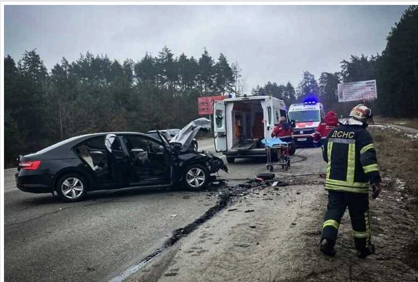
Під Києвом на швидкості зіткнулись два легковики: одного з водіїв з понівеченого авто діставали рятувальники

У Бучанському районі Київської області сталась аварія за участі Skoda Octavia та Suzuki Swift. Водій останнього авто був травмований, і щоб дістати його із понівеченої машини викликали рятувальників.