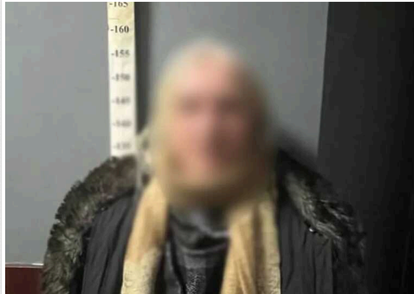
У столиці жінка за допомогою ножа з'ясувала стосунки зі співмешканцем: чоловіка госпіталізували

У Дніпровському районі Києва під час конфлікту жінка кілька разів вдарила співмешканця ножем. Постраждалого, якого пізніше знайшли на вулиці перехожі, госпіталізували до лікарні.