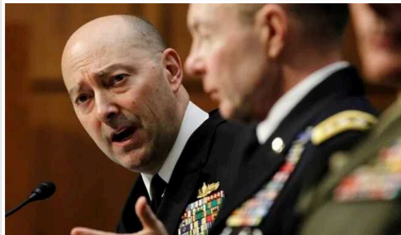
Кінець війни в Україні може бути за сценарієм Кореїської війни з окупацією Росією частини території, - колишній головнокомандувач НАТО Ставрідіс

Кінець війни в Україні може бути дуже схожим на кінець війни в Кореї, коли частина України залишиться окупованою російськими військами, вважає колишній верховний головнокомандувач НАТО Джеймс Ставрідіс.