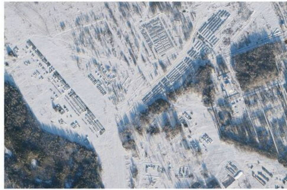
Open-source intelligence, such as this satellite image of Yelnya, Russia, from December 2021, helped the US government convince the public that its warnings about Russia's plans to invade Ukraine were credible.

Scouring open-source intelligence may not have the same cachet as undercover work, but it's become a new priority for the US intelligence agencies.