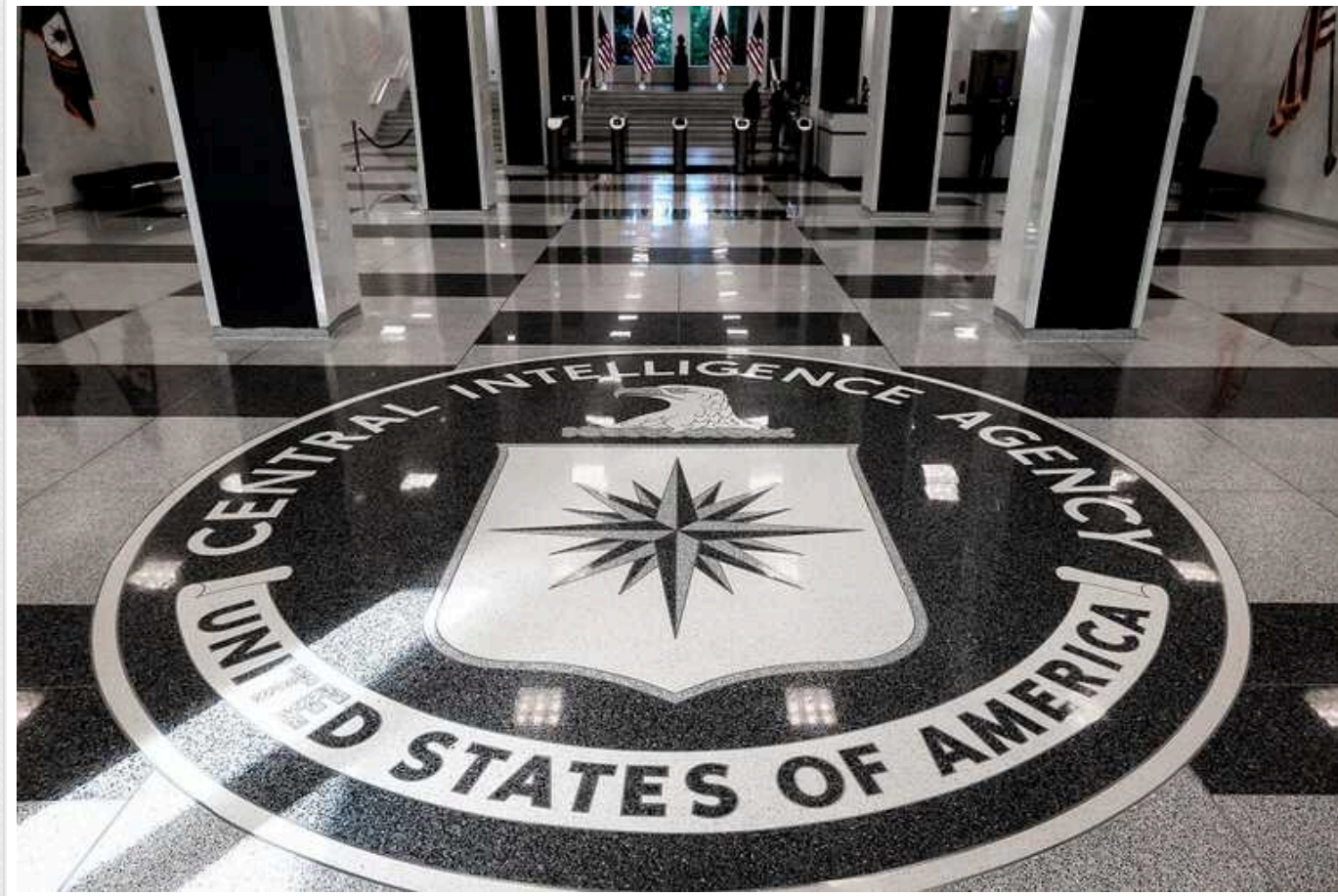
У ЦРУ аналітики по РФ не можуть запускати Telegram на комп'ютерах, - Bloomberg

У ЦРУ співробітникам забороняють своїм аналітикам по РФ запускати Telegram на комп'ютерах, повідомляє Bloomberg із посиланням на джерела.