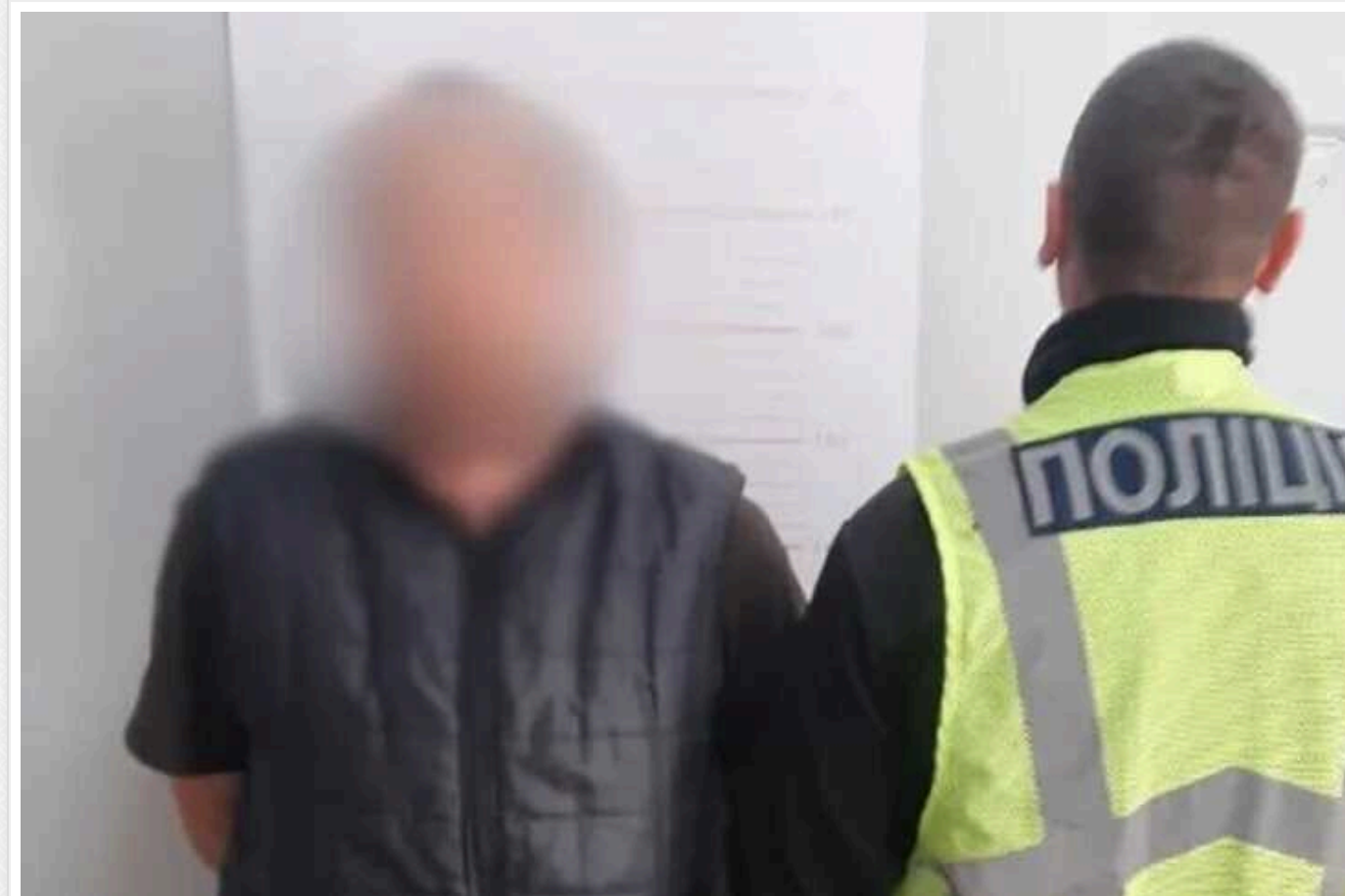
У столиці судитимуть чоловіка, який під час сварки вбив гостя: вдарив ножом у спину

У Києві судитимуть чоловіка, який під час конфлікту вдарив свого гостя кухонним ножом у спину. Від отриманого поранення потерпілий помер на місці події.